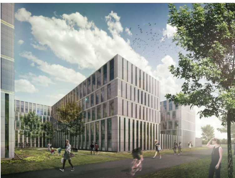
Figuur 1 | Impressie fase 2A.